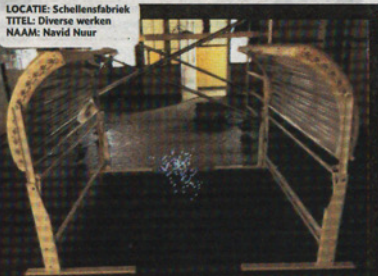
LOCATIE: Schellensfabriek TITEL: Diverse werken NAAM: Navid Nur