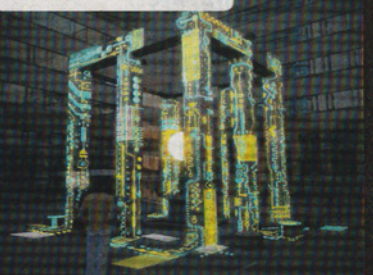
LOCATIE: Vestdijk (patio gebouw Lage Landen) TITEL: 'River of light' NAAM: Mr. Beam

- Ze zijn nog niet klaar. Er is nog niks te zien. - Ja, enorme stellingen en ladders aan de zijkant van de Lage Landen. En spouwende mensen. - Dat wordt de hele dag doorblikken tot aan de opening van Glow. - Wat moet het worden? - Een lichtgevende bol tussen die