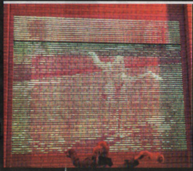
LOCATIE: Genderstraatje TITEL: 'ASCILLIVE' NAAM: ASCII Art Ensemble

- De Tip voor Glow, dit. Moet je kijken: je ziet jezelf terug op beeld. In lettertjes. - Nou, dans maar eens wat dan! - Hahahahaha, echt briljant. - We kunnen een schimmen-film maken. - Het decor is in elk geval ideaal: dik schimmig hier. - Durven Glow-mensen hier wel doorheen te stiefelen? - Tja, het hoort helemaal bij 'Re-discovering Eindhoven', niet voor niets het thema van deze Glow. - Plakkerige stegen, verlaten fabrieken en de monsterlijke achterkant van de Heuvelgalerie. Inderdaad: plekken waar je nouit komt. Dat maakt het extra bijzonder.